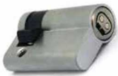
EU1035 / EU1055

Instalación sencilla ya que bastaría con sustituir el cilindro mecánico por el electrónico.