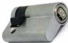
EU1035 / EU1055

Se establece la comunicación entre ambos para verificar la autorización de aperturas. La llave como el cilindro registra las aperturas realizadas. Instalación sencilla ya que bastaría con sustituir el cilindro mecánico por el electrónico.